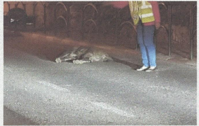
החזיר שפגע והורכב ברחוב שמשון

האירוע ברחוב שמשון הסתיים ללא נפגעים בנפש, פרט לחזיר שמת מהפגיעה שספג. עדת ראייה: "זה ממש מסוכן, כל מה שקורה בכרמל זה פשוט קטסטרופה"