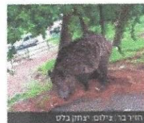
חזיר בר

יו"ר ועד רוממה החדשה מספר שהלך לזרוק אשפה והותקף • "עכשיו אני יורד למטה עם מקל או נבוט"